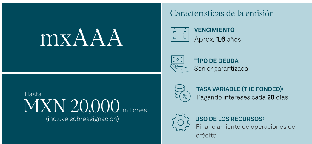
Perfil de fondeo*