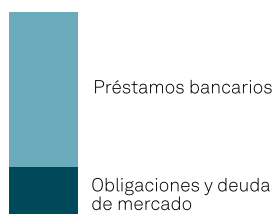
Perfil de fondeo*