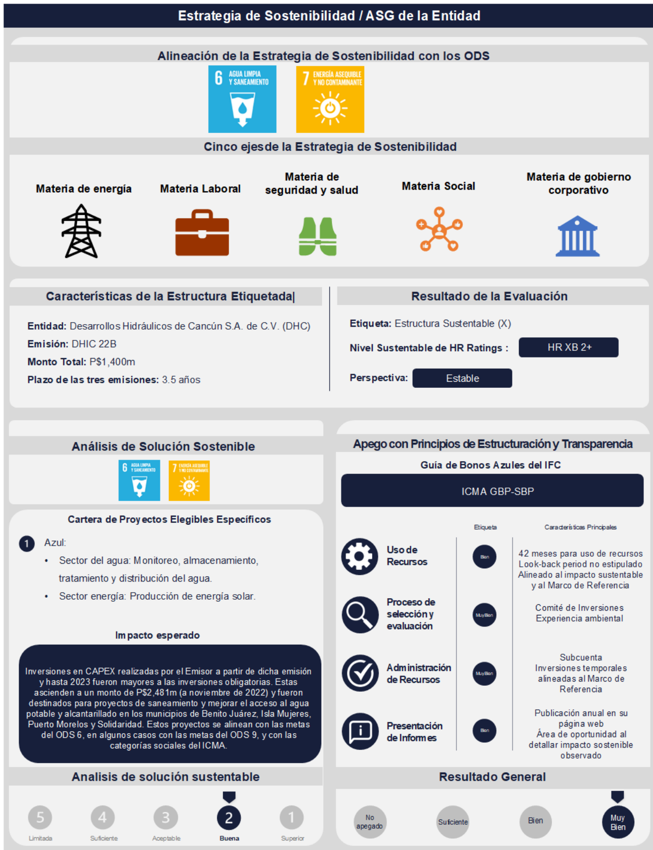
Figura 14. Características Generales del Bono Azul