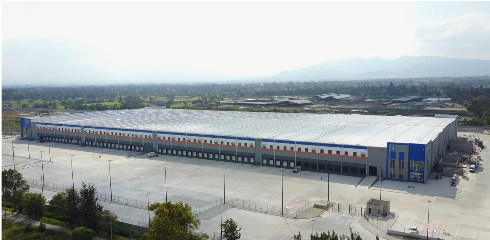
Danhos Industrial Palomas Nave I